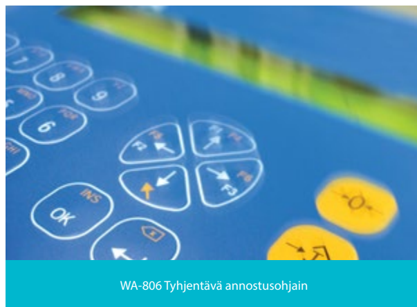
WA-806 Tyhjentävä annostusohjain

Jokaisen onnistuneen tai keskeytetyn annostuksen jälkeen punnitustiedot tulostetaan ja lisätään summalaskuriin automaattisesti. Summalaskuri sisältää kumulatiivisen annostusten nettopainon sekä annostusten lukumäärän. Summa voidaan esittää näytöllä sekä tulostaa.